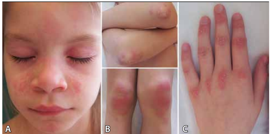
Obrázok 1. Typické kožné zmeny u pacientov s novozistenou JDM. A) heliotropný exantém lokalizovaný periorbitálne a malárny raš (motýľový exantém) na lícach a koreni nosa, B) Gottronove papuly nad veľkými kĺbmi, C) symetricky rozložené Gottronove papuly nad malými kĺbmi rúk (metakarpofalangeálnymi, proximálnymi a distálnymi interfalangeálnymi)

U jednej pacientky chýbajúce zmeny na MRI korelovali s absenciou svalového postihnutia. U všetkých pacientov bol prítomný nález kapilaritídy pri vyšetrení nechťových lôžok, ktorý bol dobre viditeľný aj pomocou dermatoskopu (obrázok 4).