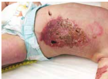
Obr. 4. Plně zhojené DE štěpy, druhý týden