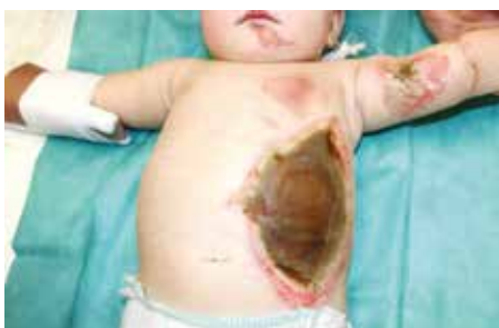
Obr. 1. Lokalizace hluboké popálené plochy IV. stupně u kojence, den přijetí