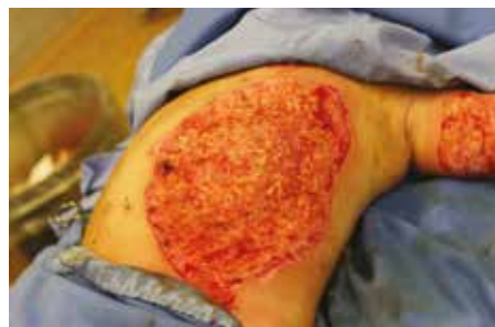
Obr. 2. Rozsah provedené tangenciální nekrektomie, třetí den