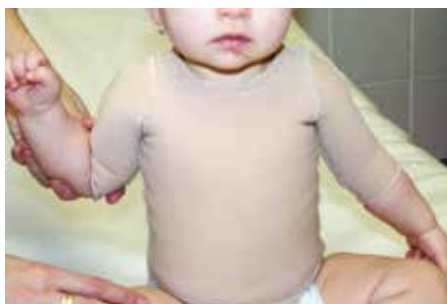
Obr. 5. Speciální elastický obleček šitý na míru, první měsíc